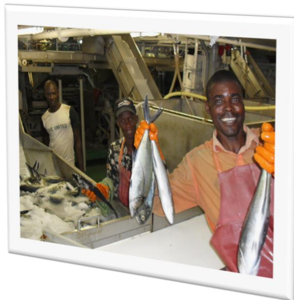
Slurry om bord på afrikansk trawler

Anlæggene kan leveres komplette med lagertank og aftapningssteder.