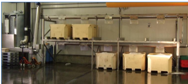
Islager. Skælis fra en BUUS V316 ismaskine opbevares i isolerede kar.