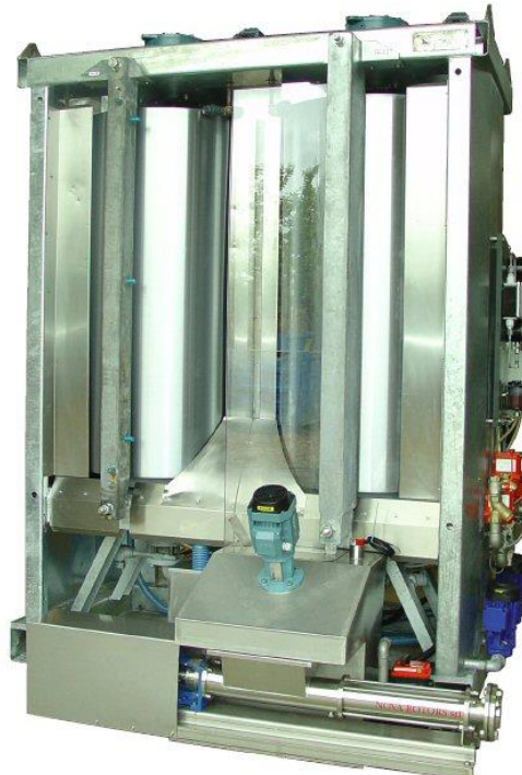
Slurry anlæg type VD746

BUUS har et beregningsprogram til korrekt dimensionering og vi foretager gerne denne beregning for at fastlægge den mest optimale løsning til netop din opgave.