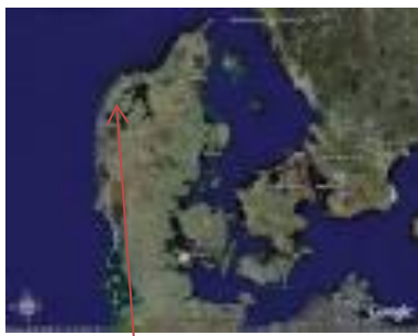
BUUS , Frøslev Mors

Vi er derfor i stand til at levere reservedele fra eget lager med dag-til-dag levering. Vore teknikere er uddannet til lige netop vores anlægstyper.