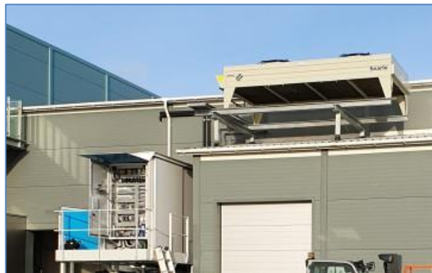
Kompressoraggregat for et BUUS 24 ton / 24t skælianlæg. CO2 DX.

BUUS' ingeniører er ISO-9001 certificerede til alle opgaver indenfor kølebranchen.