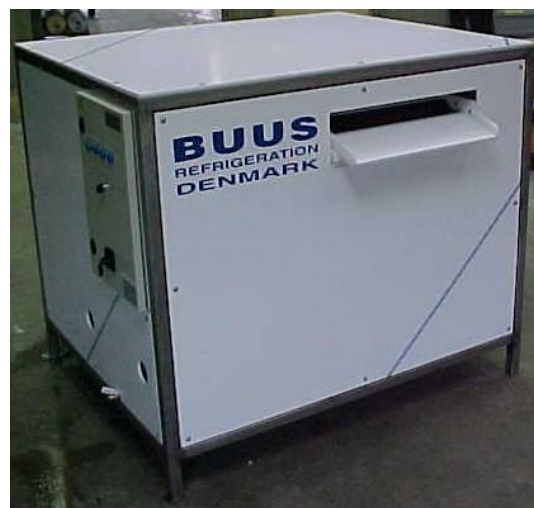
Skælimaskine-unit. Type SD1000ULT. Kapacitet: 1000 kg/24t. For tropiske forhold.

BUUS udfører opgaver over hele Danmark og Europa. Hvad kan vi gøre for dig og din virksomhed?