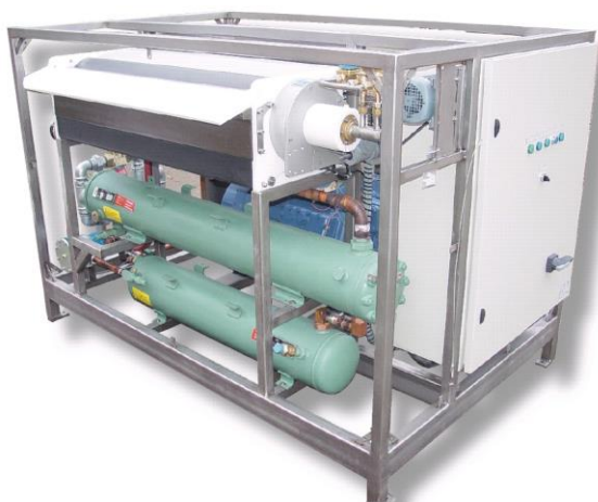
Ismaskine unit. Marine type.