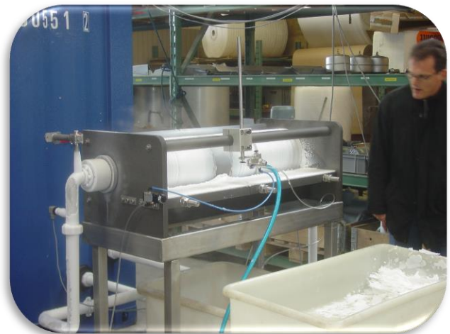
Chokfrysning af cellulose. -80^{\circ}\text{C} anlæg