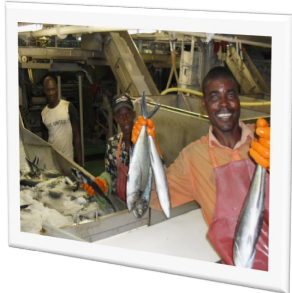
Slurry om bord på afrikansk trawler

Anlæggene kan leveres komplette med lagertank og aftapningssteder.