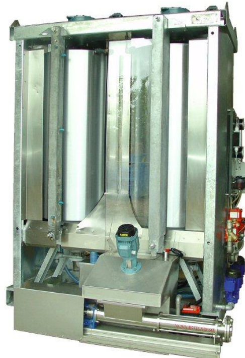
Slurry anlæg type VD746

BUUS har et beregningsprogram til korrekt dimensionering og vi foretager gerne denne beregning for at fastlægge den mest optimale løsning til netop din opgave.