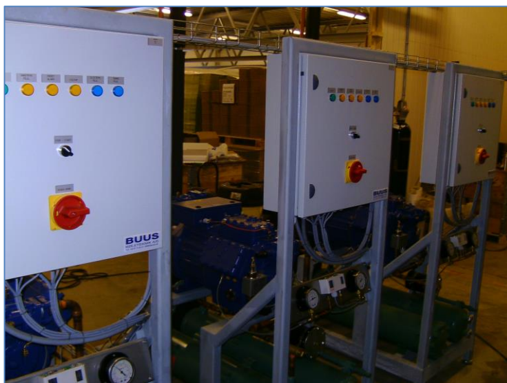
Fiskefarming i Norge. 3 x SF8000USW ismaskiner