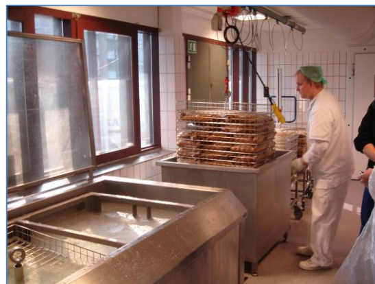
Køling af sous-vide. "Madservice a la carte", Brønshøj.

BUUS udfører opgaver over hele Danmark og Europa. Hvad kan vi gøre for dig og din virksomhed?