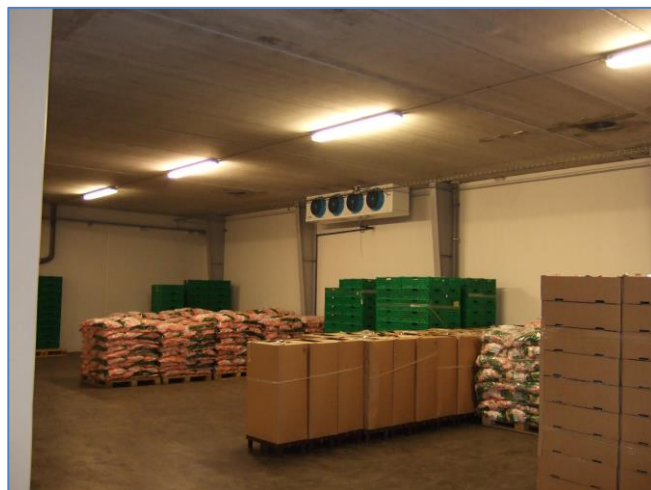
Kølerum. Tange Frilandsgartneri A/S

BUUS' kølemontører er certificerede til alle opgaver på køle- og fryseanlæg.