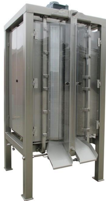
Blodplasma ismaskine type VS373