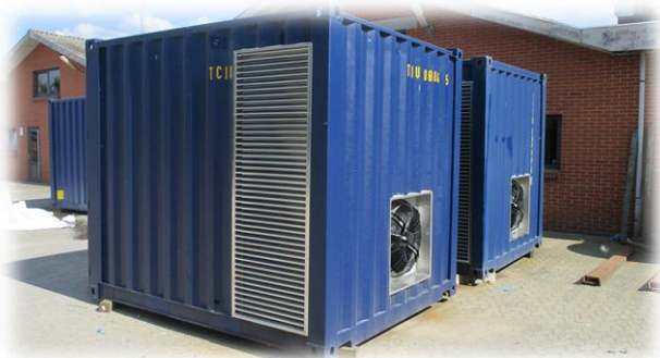
Komplet is fabrik, Container løsning