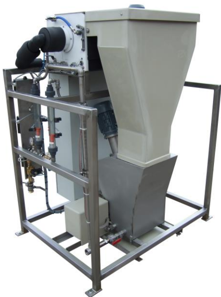
Slurry anlæg type SD8000

Kapaciteter: Slurry ismaskiner producerer tre gange så meget slurry is som skælis. En skælismaskine kan således producere tre tons slurry is.