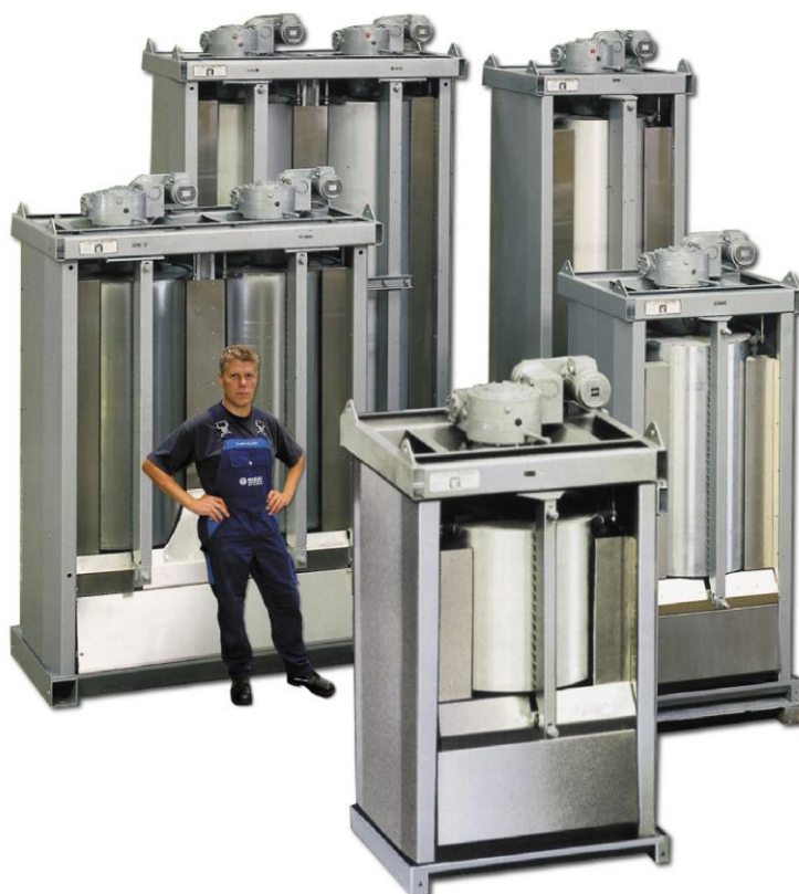
Ismaskiner type V-VD

Ismaskine type VD746ULTS. Leveret til kunde i mellemøsten.